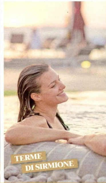
TERME DI SIRMIONE